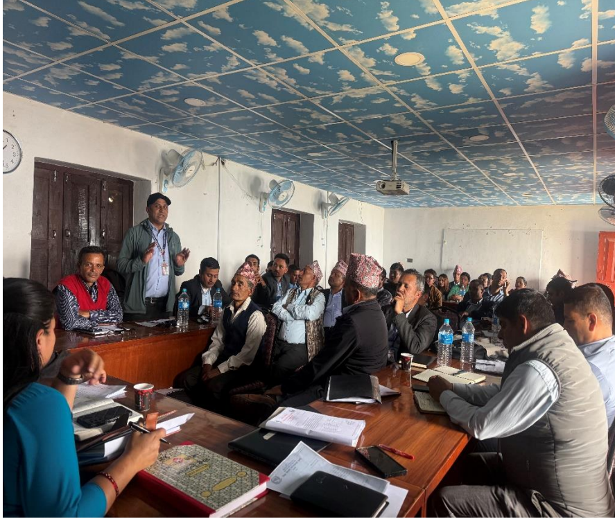
छलफल तथा सुझाव संकलन